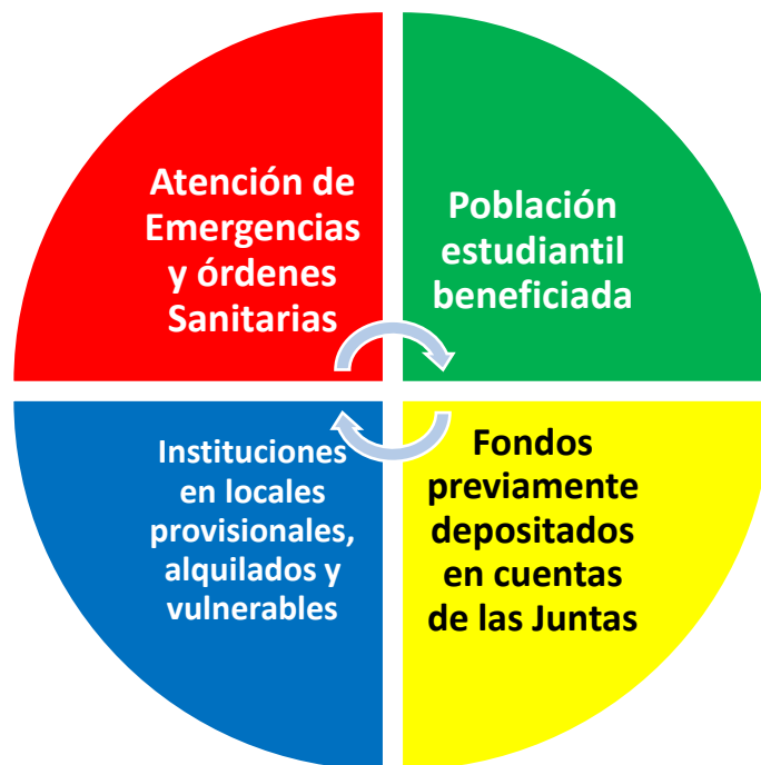
Gráfico 2: Indicadores de la estructura de prioridades del Plan de Inversión