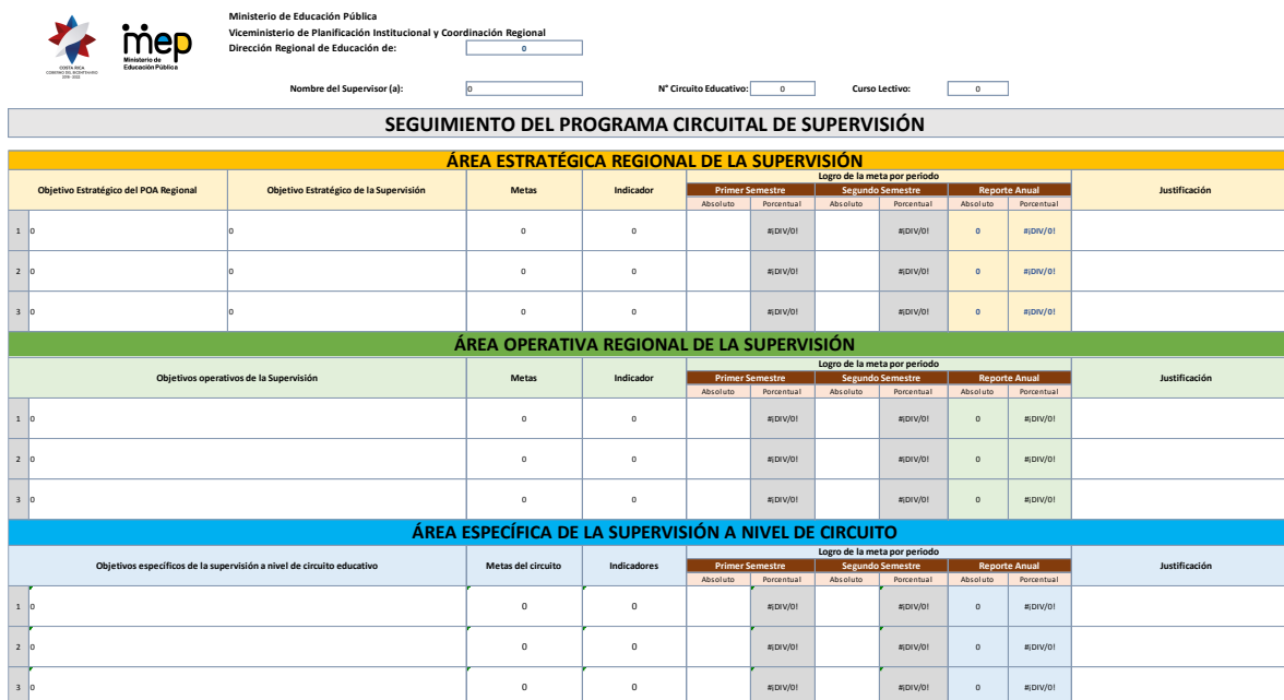
Figura 5 Matriz de seguimiento e informes

En la columna de justificación se registra información relevante de situaciones o eventos (evidencias objetivas) que han incidido (favorable o no) en la ejecución de las metas programadas; esta acción aplica para cada uno de los informes (semestral y anual). Estas referencias de tipo descriptivo constituyen un insumo complementario para el análisis y valoración de los datos numéricos consignados en la columna de logro y servirán para sustentar la toma de decisiones.