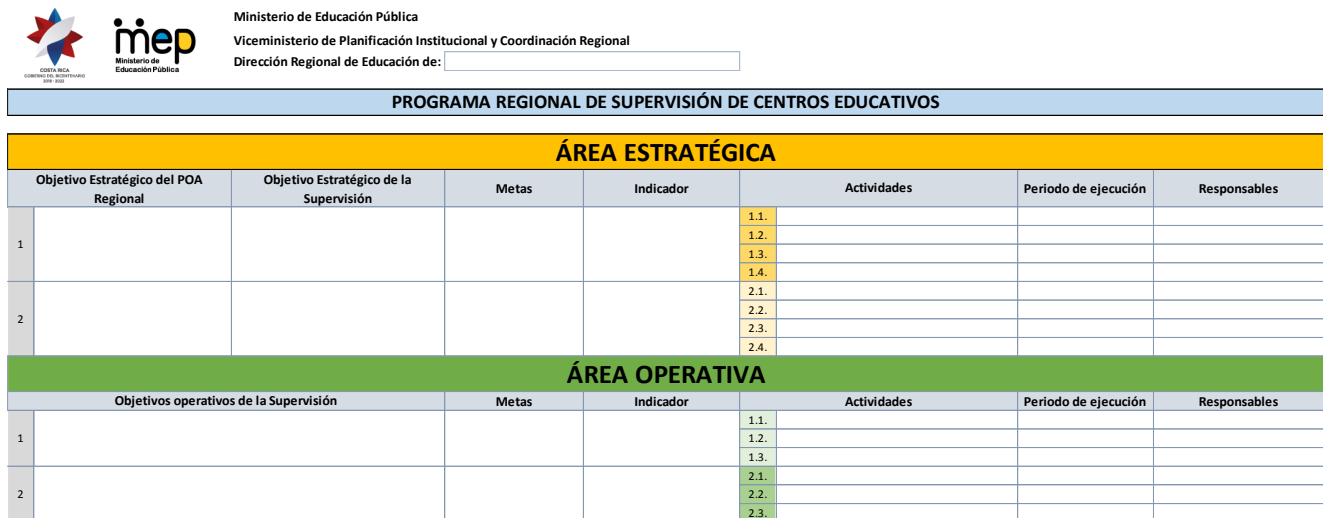
Figura 1 Plantilla para elaborar el Programa Regional de Supervisión

Tanto en el nivel estratégico como en el operativo se debe asumir el proceso de elaboración de: objetivos, metas, indicadores y actividades.