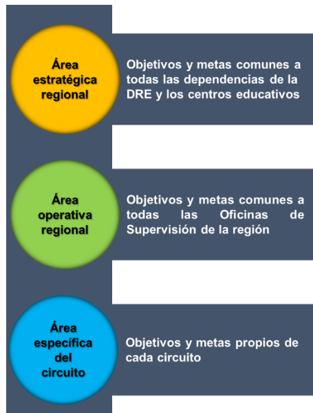
Figura 3 Énfasis de las áreas

1. Área estratégica de la supervisión a nivel regional (color amarillo): contiene la información que proviene del área estratégica del PRS (la cual, a su vez, proviene del POA regional). Parte de la información que se ubica en esta plantilla se despliega automáticamente, según los datos anotados en el PRS. Sin embargo, la meta no podrá ser igual a la establecida en el PRS, por cuanto se prevé que cada circuito deberá cumplir con un porcentaje de la meta global (definida en el PRS).