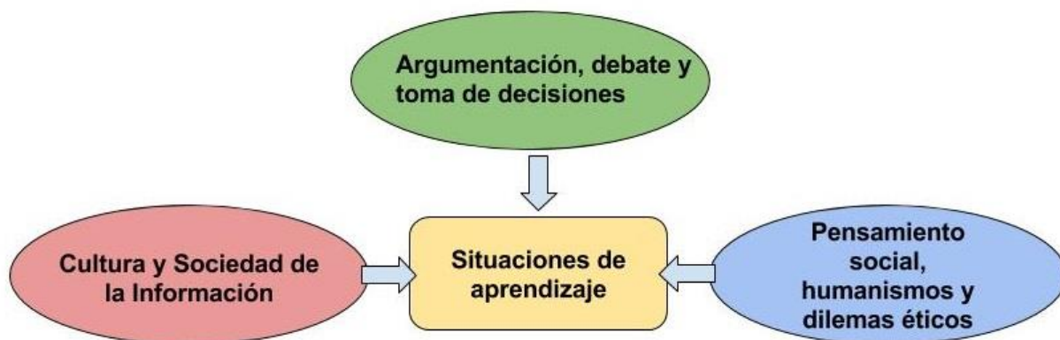
Gráfico 2. Ejes temáticos del programa

Desde sus fundamentos mismos, se determinan las áreas temáticas de Filosofía, las cuales se distribuyen organizada y continuamente en el trayecto de los tres trimestres de quinto año, de manera tal que el abordaje de las fuentes del saber desemboque en nuevas habilidades específicas para las personas jóvenes de hoy en día, pertenecientes a un momento histórico particular e integrantes importantes de una nueva ciudadanía.