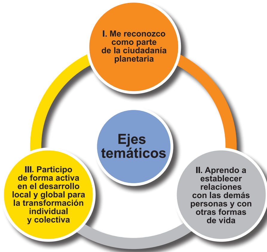
Figura 2. Esquema de los ejes temáticos en los programas de estudio de Orientación

En la siguiente figura se presentan los tres ejes temáticos que sustentan los Programas de Estudio de Orientación: